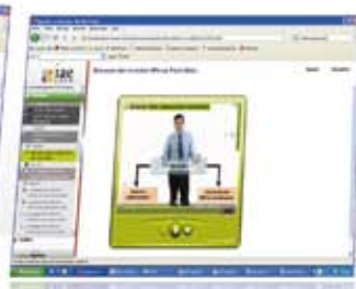
Vidéo Le Prof