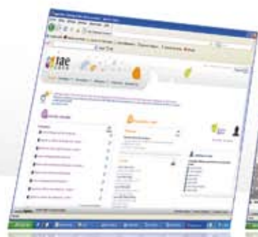
Accueil campus numérique